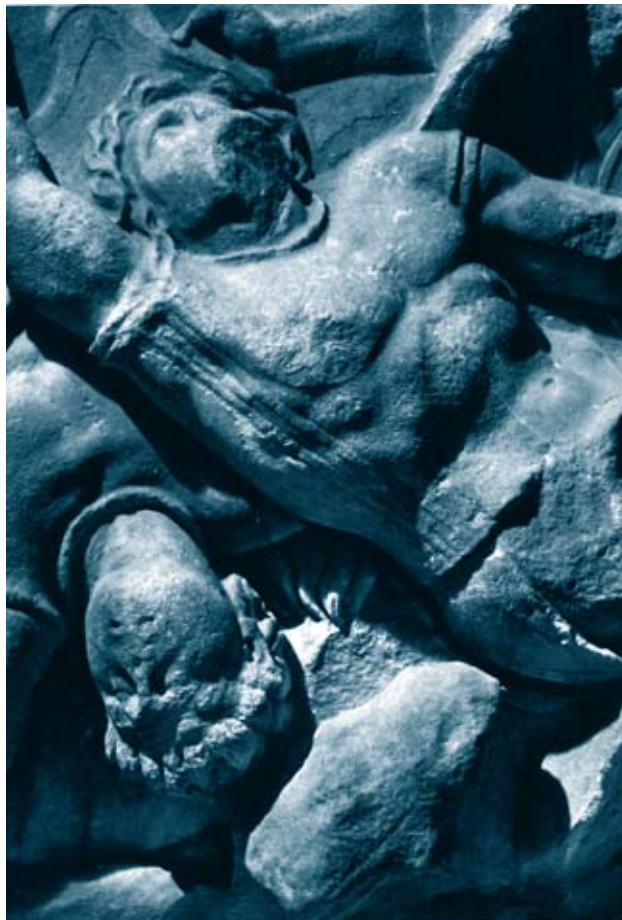
Pergamo Grande Ara - Fregio di Telefo, Staatliche Museum Berlino

" Do what thy nature doth now require. Resolve upon it, if