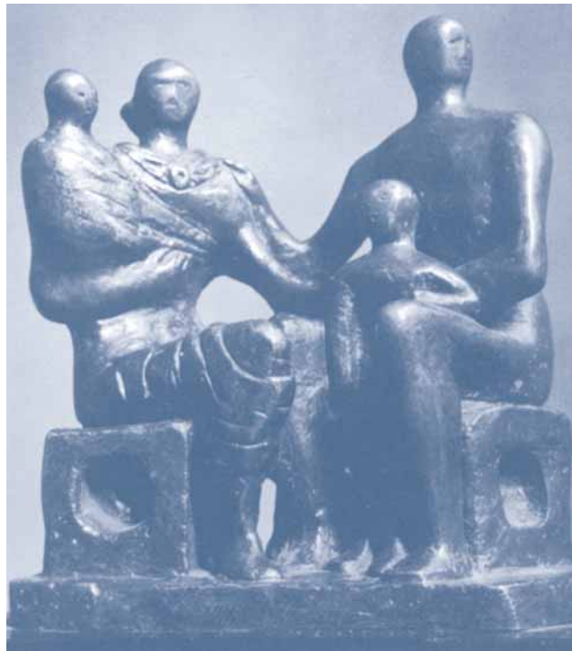
Henry Moore - bozzetto per un Gruppo familiare