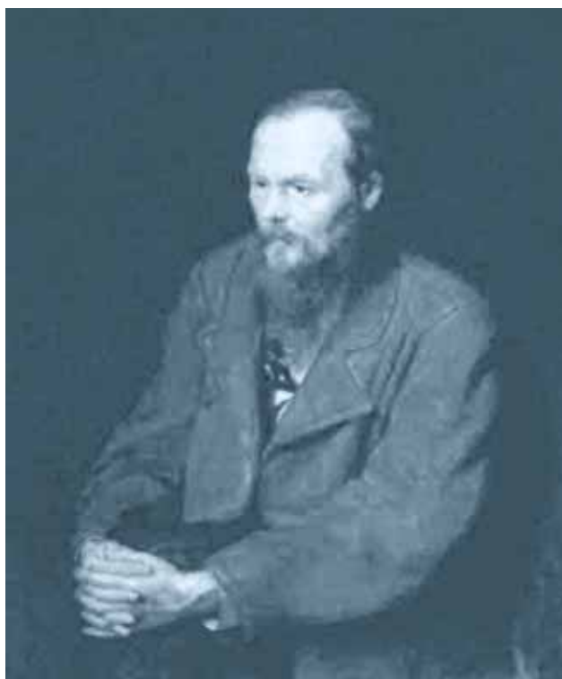
Vasily Perov, Fedor Dostoevskij, 1872

In una lettera inviata ad un'amica dopo la pubblicazione del romanzo Dostoevskij scrive di essere insoddisfatto del risultato del suo ultimo lavoro. Sente di non avere sviluppato appieno il personaggio che aveva nel cuore, di non essere riuscito ad avvicinarsi alla figura, umana e sovrumana, che lo aveva ispirato: Gesù Cristo. Con che meraviglia ci avrebbe avvolti se il risultato