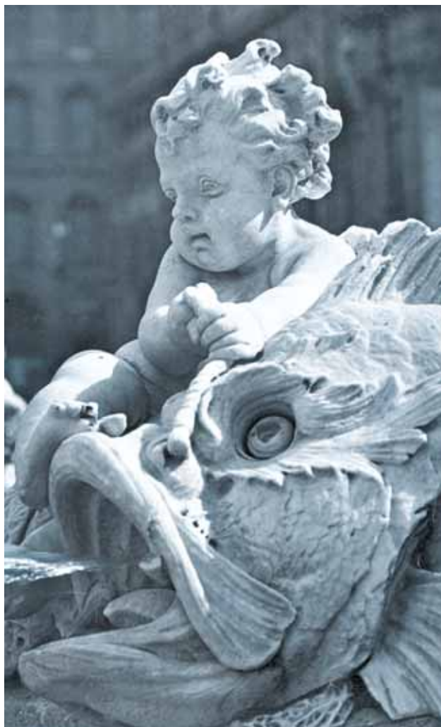
Tritone di Villa Borghese, Roma, particolare

L'abbiamo provata tutti questa esperienza, nei campi più diversi. Tutto comincia con un problema da risolvere: trovare un sistema di rotazione delle ferie che soddisfi equamente le esigenze dei dipendenti e quelle dell'ufficio; improvvisare una cena per otto reinventando un gigantesco piatto unico tra avanzi e misere scorte della credenza; organizzare una caccia al tesoro per il compleanno dei bambini che li diverta e li tenga occupati e all'aperto il più possibile; cimentarsi con l'acquarello o iniziare a suonare il piano a sessant'anni; far quadrare il bilancio familiare; modificare il setting terapeutico perché stiamo diventando sordi; cambiare i colori del giardino; inventarsi una conduzione di gruppo adeguata per un gruppo di grandi disabili misto (ciechi e grandi spastici); spiegare Dante ai liceali partendo da Bukowsky; ripartire con la moto sostituendo il fusibile che non abbiamo con la stagnola del-