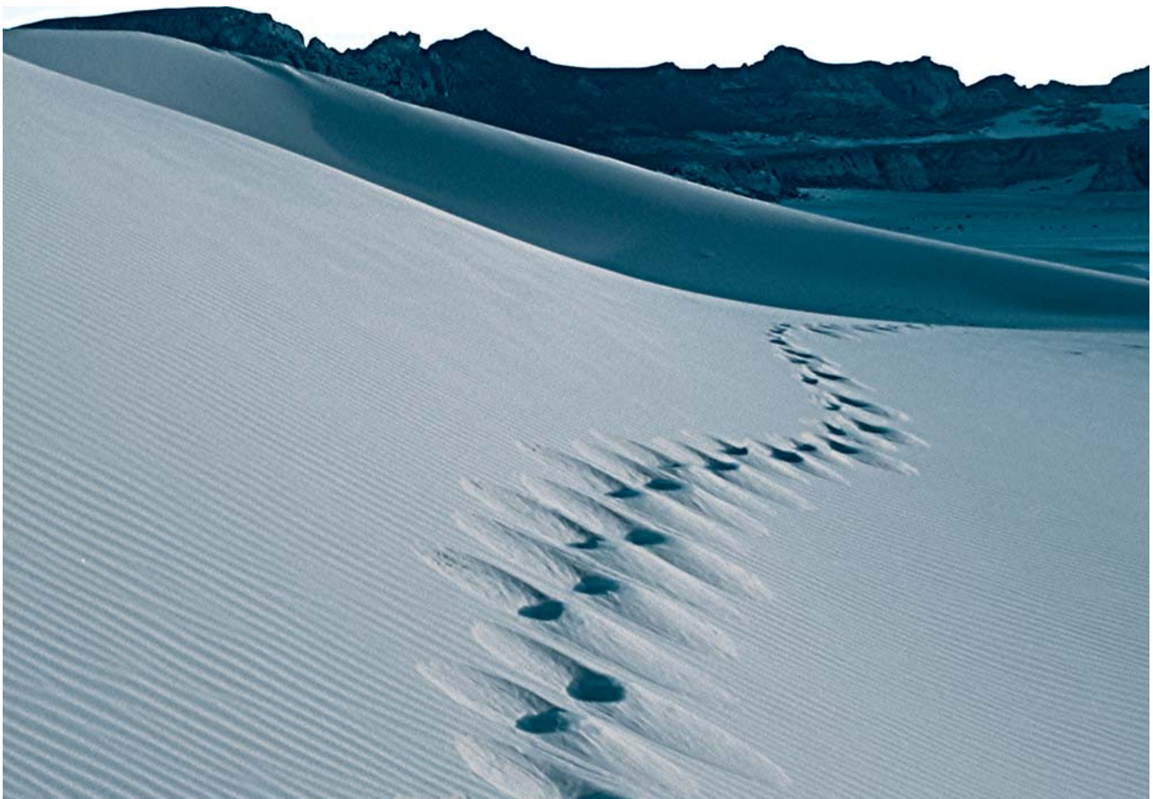
P.M. Bonacina "Silenzio" foto 2007

L'Ascolto, mi vien da dire, dovrebbe essere "ecologico", pulito, nel senso che chi vuole entrare in sintonia con l'altro (ogni tipo di altro, come ho detto prima) dovrebbe aver fatto piazza pulita di etichette, pregiudizi, proiezioni, insomma di tutti i propri filtri soggettivi e porsi di fronte all'interlocutore con cuore e orecchi nuovi, come se fosse la prima volta. E' possibile questo? Non so, ma so per