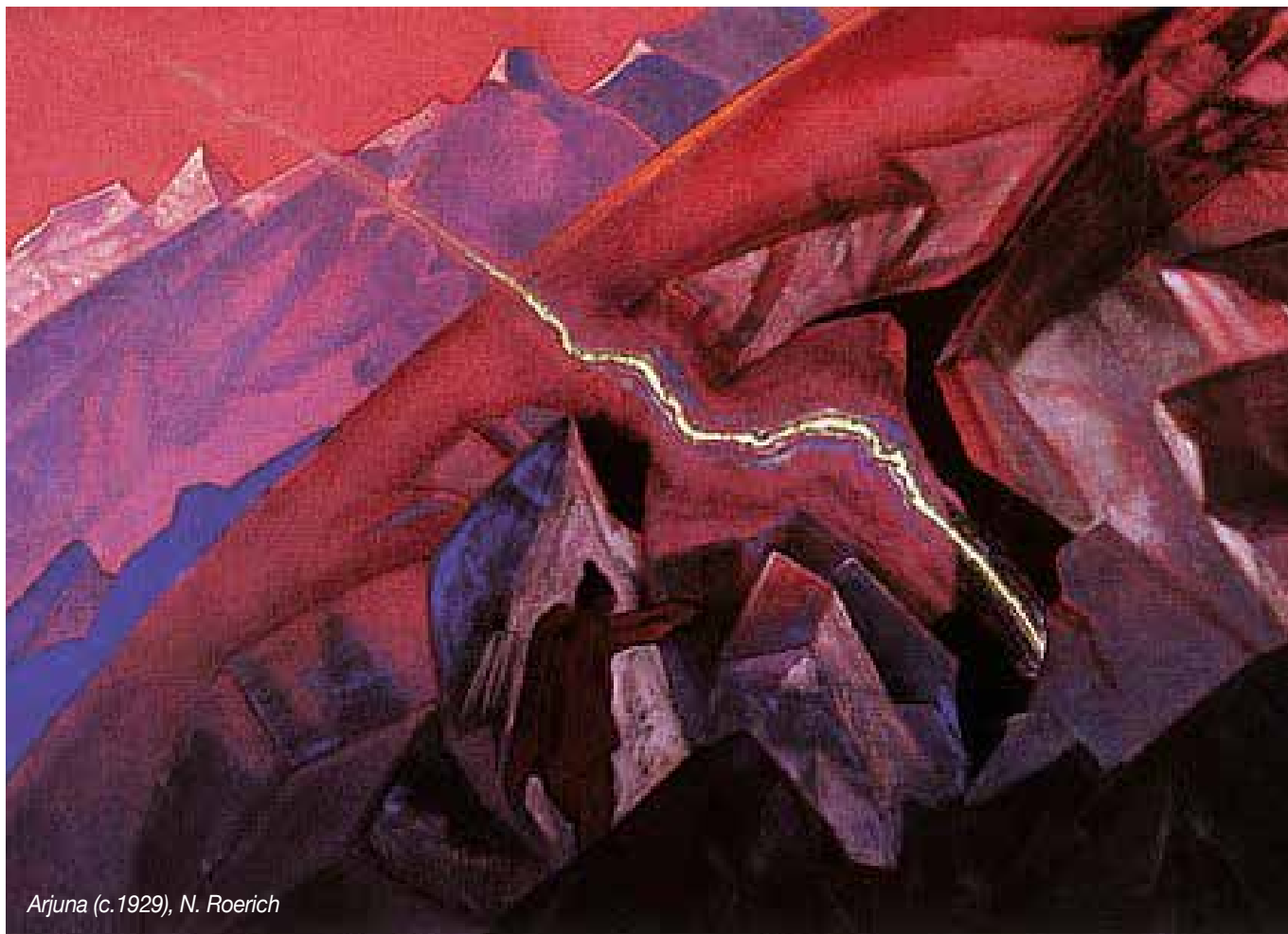
Arjuna (c.1929), N. Roerich