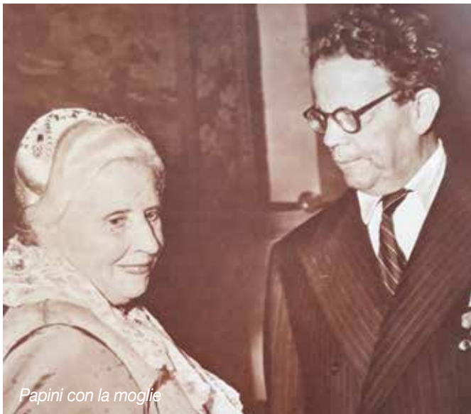
Papini con la moglie

Nel 1944, come detto, divenne terziario francescano insieme alla moglie e prese il nome Bonaventura, provando «vera profonda gioia» (Diario). Nella figura di Bonaventura, Bargellini vede riunirsi l'acume, la logica e l'intelligenza inestinguibile di Papini con il fuoco che arde in lui perennemente e con la forza mistica della sua fede. Così scrive: «Tutta la vita di Giovanni Bonaventura Papini si è svolta sotto il segno dell'intelligenza, di cui la mente tersissima faceva specchio luminoso e chiaro. Non però freddo; non però sterile, ma, al contrario, fervoroso e caloroso. [...] L'intelligenza di Papini seguì l'itinerario bonaventuriano, nel desiderio, nel gemito, nella caligine e nel fuoco.»