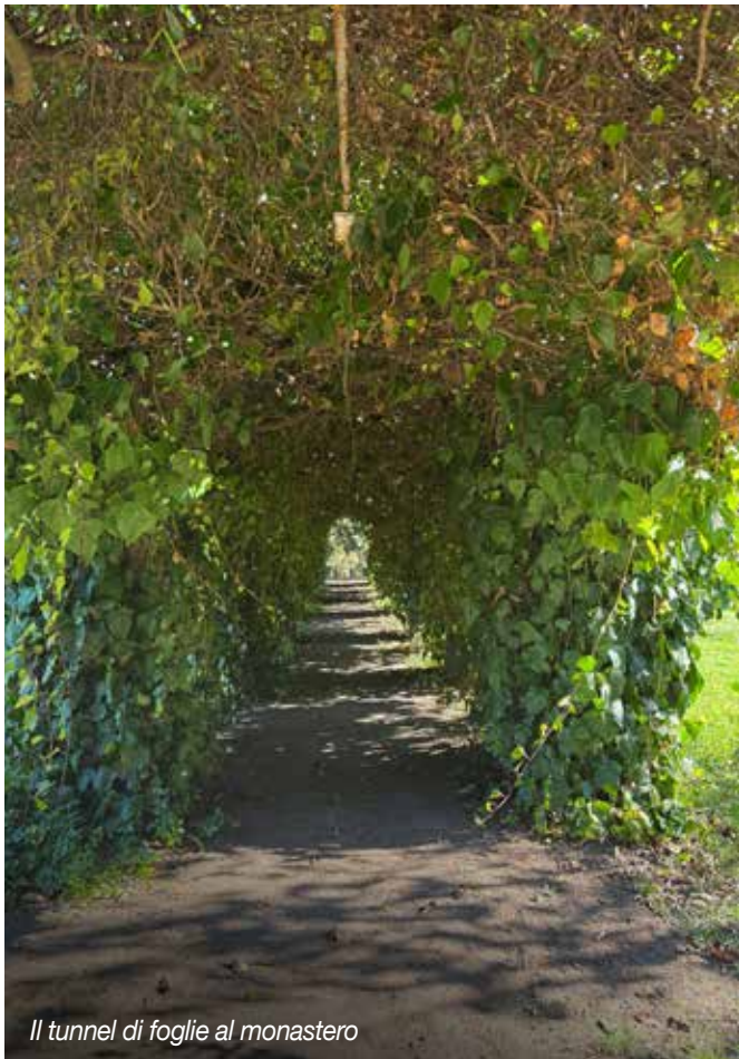
Il tunnel di foglie al monastero

Quale patrimonio ci ha lasciato il Meeting? Mi ritrovo con un profondo interrogativo. Mi chiedo quale influsso stia esercitando su di me la presenza del luogo nelle convinzioni, nelle attività, nella storia, nelle speranze future, nelle persone che si sono trovate tra queste mura, persone con tutti i loro punti di forza e di debolezza. Sento che c'è un'energia combinata intessuta nella struttura di tutti gli anni di pratica e insegnamento svolti in questo luogo. Un'energia collettiva d'amore che attraversa tutte le persone di Alle Fonti. Ognuno emana le proprie energie personali e uniche che si uniscono per essere più della somma delle singole parti. È un potere umano collettivo di energia amorevole che è radicato in tutti gli aspetti del Meeting. Mi rimane un senso di appartenenza, un senso di essere chiamata a un compito, a un lavoro da svolgere, a poter fare la mia parte.