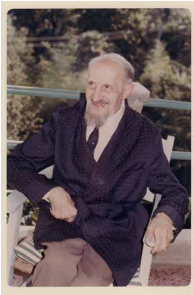
Roberto Assagioli Summer 1966 Capolona