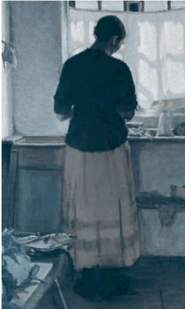
Anna Ancher "La ragazza in cucina" 1883-86 Collezione Hirschsprung Copenhagen

Let us use a good perception towards the persons we wish to help. ■