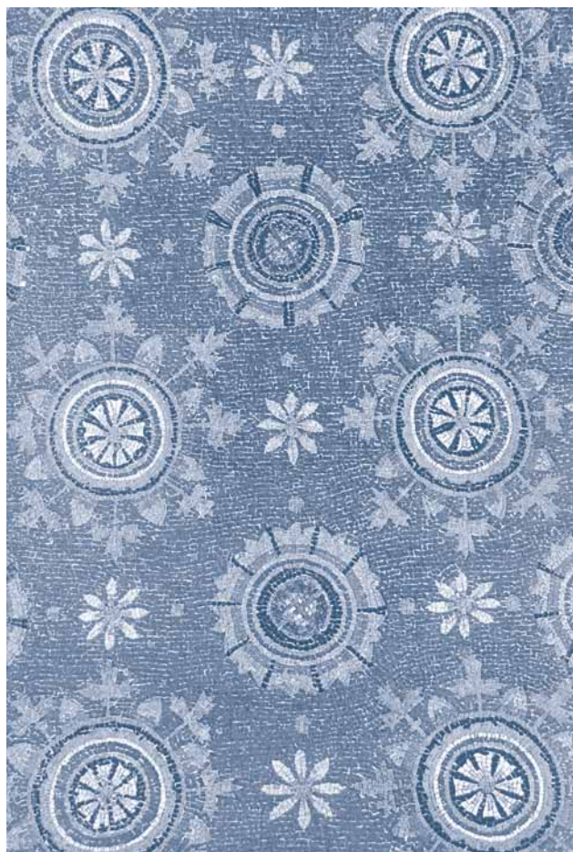
"Cielo stellato" - Mosaico Tomba di Galla Placidia, Ravenna (sec. V)

Vediamo ora quali sono le condizioni necessarie per una cooperazione feconda. La prima è la comunicazione.