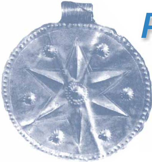
Gioiello ugaritico XV-XIV secolo a.C.