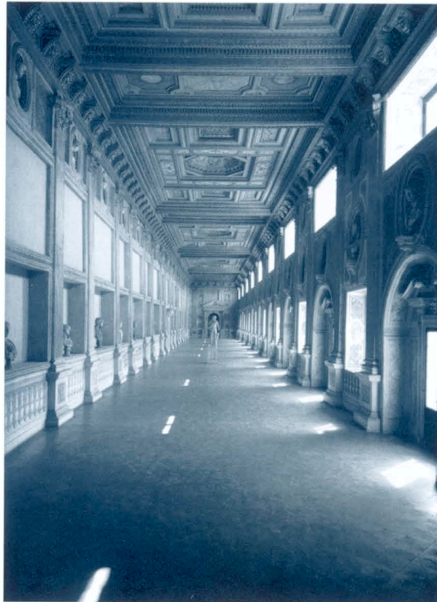
Mantova, Palazzo Ducale. Galleria degli Imperatori

Già nell'antichità, con Aristotele (che ne aveva sviluppato un'interpretazione simbolica) e Ippocrate (che lo aveva utilizzato per le sue diagnosi, in quanto rivelatore di sintomi nascosti), il sogno era stato oggetto di studio. Particolarmente interessante l'opera sull'interpretazione dei sogni di Artemidoro di Daldi, del II secolo d. C., ricca d'intuizioni che sono state fonte d'ispirazione per numerosi ricercatori. Nell'età moderna i sogni avevano su-