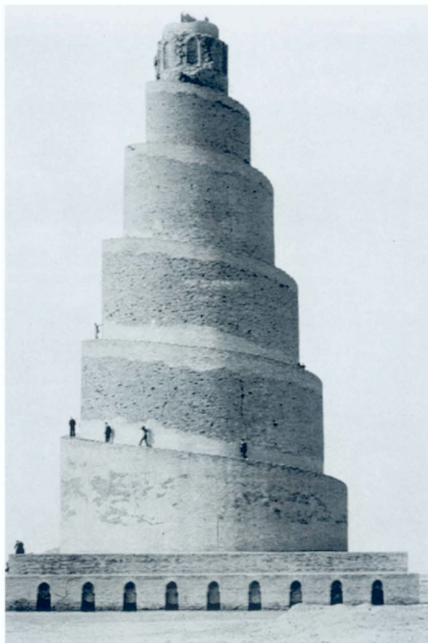
Minareto della Moschea di Samara - Iraq - IX secolo

desideri, ma nello stesso tempo tutti possiamo ricordare altri sogni dal contenuto radicalmente diverso, che hanno prodotto in noi angoscia e paura. D'altra parte, lo stesso Freud riporta la defi-