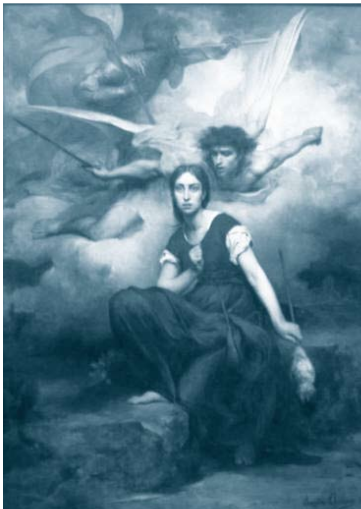
Giovanna d'Arco ascolta la "voce" dell' Arcangelo San Michele (Autore ignoto)

He has become a Warrior – the Hero of the Light. ■