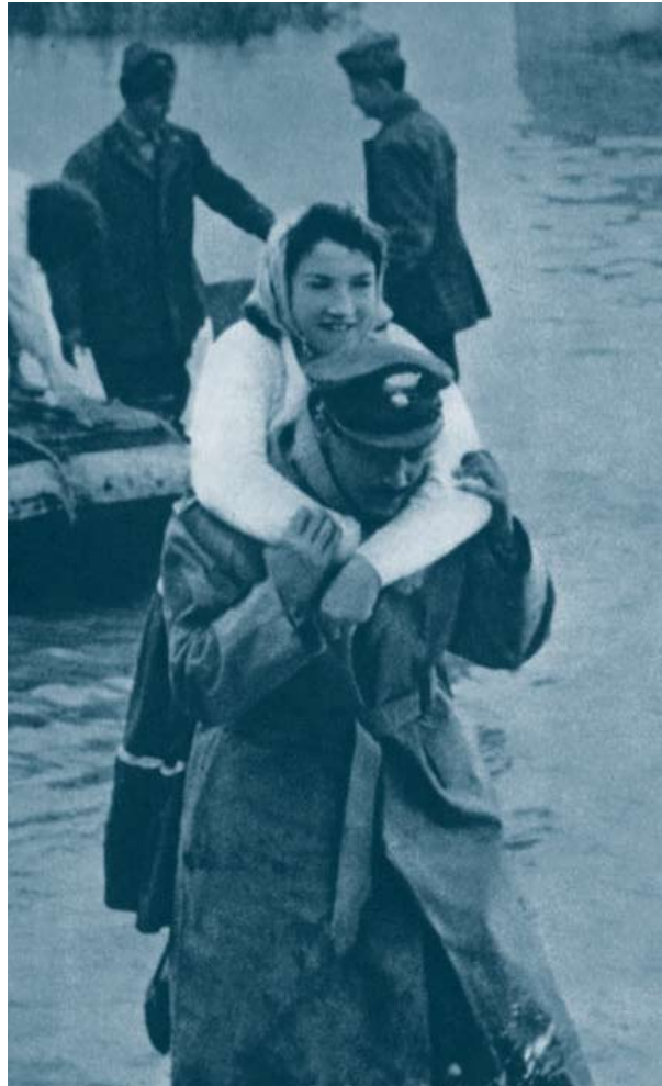
Eroi moderni Alluvione del Polesine - autunno 1951

The respect for every human being is an essential quality for the warrior. He is not Mars the Warrior but he is the Hero (from eros = love) who fights on the level of conscience. The warrior does not fight an enemy but faces the dark parts of himself.