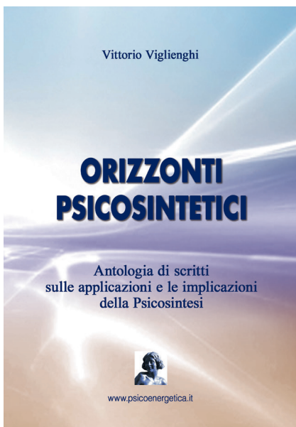
ORIZZONTI PSICOSINTETICI Vittorio Viglienghi 2016 www.psicooenergetica.it