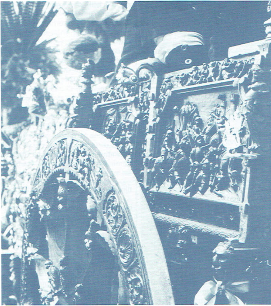
L'esperienza creativa si manifesta a seconda del campo d'interessi e della personalità di chi la vive.

problema, tra essi Edward De Bono, il quale nel suo "Pensiero laterale" illustra un altro metodo creativo per concepire idee nuove ed originali. Egli fa analizzare le probabili soluzioni al problema guardandole non con il cosiddetto "metodo verticale" (quel metodo, usato in maggioranza, che segue il normale funzionamento della mente, secondo una logica ordinata, seguendo gli schemi abitudinari), ma con il metodo detto del "pensiero laterale". Con questo metodo, tutte le possibili soluzioni, anche quelle apparentemente impossibili, vengono prese in considerazione. Procedendo con più libertà e disponibilità, in maniera gioiosa si scoprono aspetti che altrimenti non sarebbero emersi.