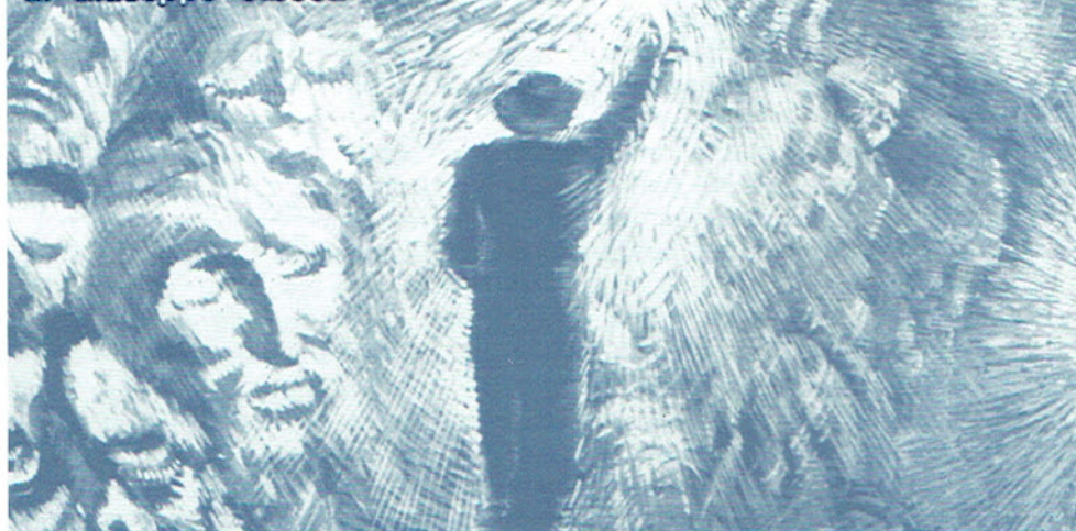
A. GRANCHI. "Vittorie della luce", 1983 (particolare)

La creatività rappresenta in una persona integrata la parte che cambia la realtà, che prepara il futuro.